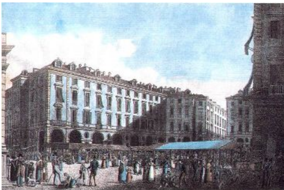
Mercato delle Erbe, Litografia di Marco Nicolosino, circa 1820 Collezione Simeom, ASTO