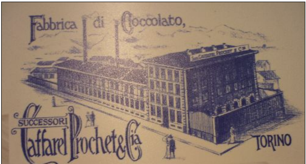
Centro di Interpretazione Circoscrizione 4, Comune di Torino, 2010